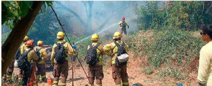
Cuatro brigadas de Conaf trabajaron en el control de la emergencia.