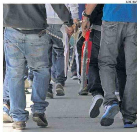
EL FALLECIDO PERTENECERÍA A LA BANDA "LOS PIRATAS".