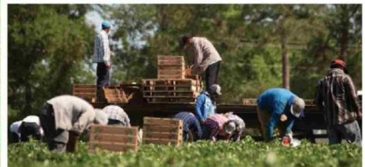
LA SNA LLAMÓ A ANALIZAR EN QUÉ GRADO la nueva Ley de Migración y Extranjería puede fomentar no intencionadamente la migración irregular y la informalidad.