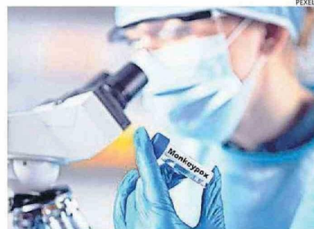
LA SEREMI DE SALUD DIJO QUE NO HAY CASOS EN EL BIOBÍO.

de septiembre habría llegado la persona a urgencias por algunos síntomas sospechosos.