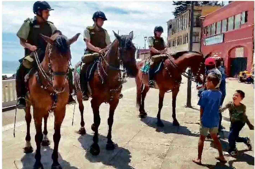
LOS CARABINEROS A CABALLO HAN SIDO POR AÑOS UNA DE LAS IMÁGENES CARACTERÍSTICAS EN LOS BALNEARIOS DE LA PROVINCIA.