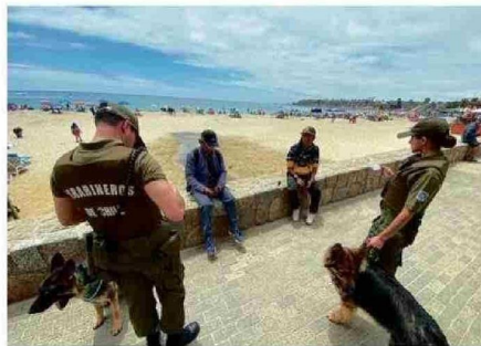
LAS PATRULLAS CANINAS CUBREN LAS PLAYAS DE LA ZONA.

Refuerzos montados y caninos, aumento de controles y estrategias de copamiento destacan en el balance inicial del plan, que busca garantizar la seguridad de turistas y residentes.