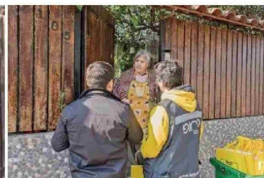
GIRO valorizó las toneladas fijadas por el MMA por segundo año consecutivo

el éxito de la gestión de residuos y el cumplimiento de las metas definidas por la Ley REP. Actualmente, GIRO cuenta con más de 360 socios productores que hacen posible que el reciclaje se masifique en nuestro país, incluyendo comunas que antes no contaban con recolección gratuita. Mientras más empresas se sumen, mayor será el territorio abarcado por el GRANSIC. El próximo año, GIRO proyecta ampliar su alcance más allá de la Región Metropolitana, para lo cual se encuentra en una fase de implementación temprana con los municipios de Puerto Varas, Puerto Montt, Llanquihue y Calbuco, donde comenzará a operar en los próximos meses.