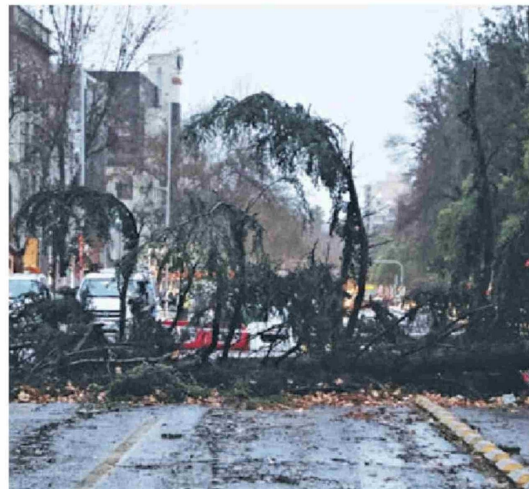
► La Alameda vio interrumpido su tránsito.