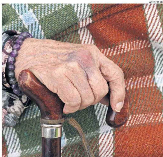
UN FACTOR CRÍTICO ES LA SALUD DENTAL Y VISUAL DE ADULTOS MAYORES: MUCHOS NO PUEDEN LEER ETIQUETAS.

mentaria se refiere a "la disponibilidad limitada o incierta de alimentos por factores sociodemográficos, ingreso económico, conocimientos y habilidades nutricionales, cercanía con lugares de abastecimiento, red de apoyo y otros".