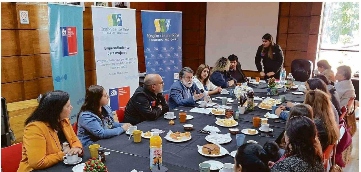
Autoridades regionales participaron de un desayuno con usuarias del programa en la comuna de Lanco.

El programa fue financiado por el Gobierno Regional de Los Ríos y su Consejo Regional a través de su Programa de Inversión por un monto de $350.000.000.