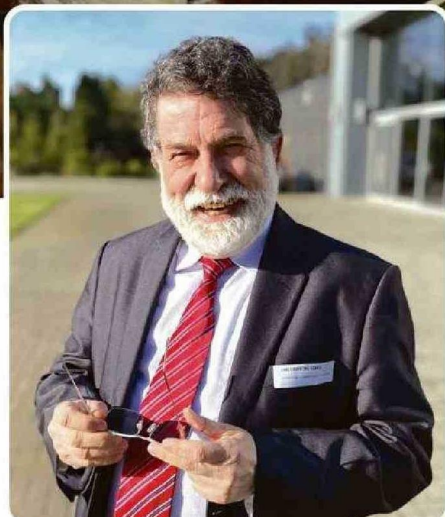
Luis Cuvertino, Gobernador Regional

Además de proporcionar capital de trabajo, ofrecemos acompañamiento en el desarrollo de sus modelos de negocio y en la mejora de su capacidad comercial”.