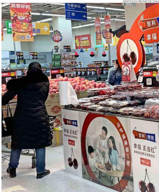
El Comité de Cerezas desarrolla una estrategia para ingresar a nuevos mercados dentro de China.