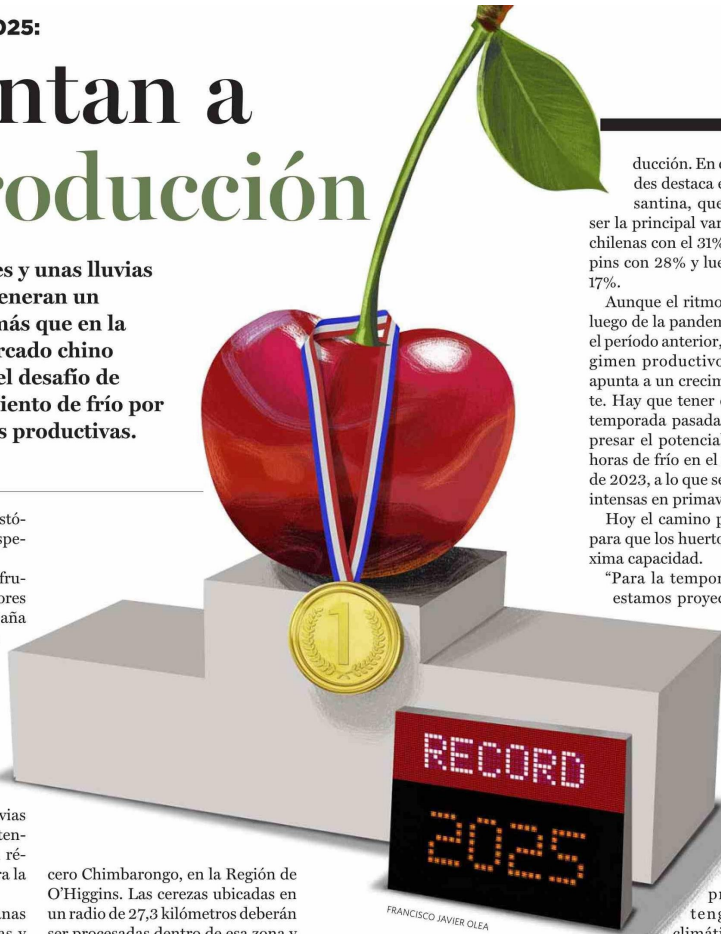
FRANCISCO JAVIER OLEA

cruciales para asegurar un buen resultado final”.