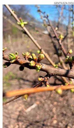
Cerezos en Ocoa, valle del Aconcagua, hace unos días.

"Hemos sumado nuevas agencias en el proceso que nos permitirán refrescar nuestra campaña, tanto en su diseño creativo como en su ejecución. De manera complementaria, estamos trabajando en el diseño de las campañas de promoción que realizaremos en los otros mercados de destino tales como el norteamericano, coreano e indio, entre otros. Respecto a India, en las próximas semanas participaremos del Chile Summit India 2024, esfuerzo público-privado que busca fortalecer vínculos institucionales entre Chile e India".