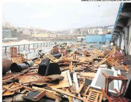
MAREJADAS AFECTARON A UN RESTAURANT EN VALPARAÍSO.