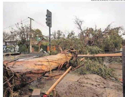
CAÍDA DE ÁRBOL AFECTÓ SUMINISTRO ELÉCTRICO EN LA FLORIDA.

(...) Este viento tan potente es histórico y era muy difícil de predecir que viniera con tanta potencia".