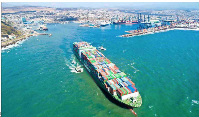
El Puerto de San Antonio y sus terminales movilizó 13,21 millones de toneladas a julio, un incremento de 13% en comparación con el mismo período de 2023.

El terminal afirma que en 2024 se advierte una mejoría respecto de años previos, pero busca que la Armada les autorice nuevas condiciones de funcionamiento.