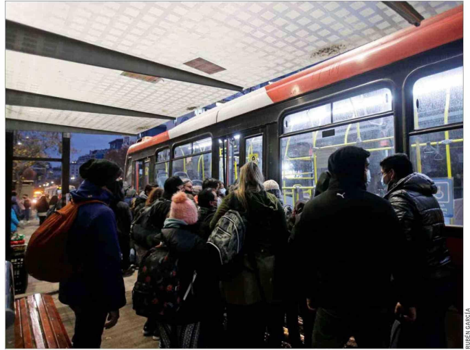
HORA DE TRASLADOS. — Aunque equidistantes al centro de Santiago, el 24% de los usuarios en San Bernardo inician sus viajes entre las 4:00 y 7:00 horas, mientras que en Lo Barnechea lo hace el 9%.

“En efecto, las variables socioeconómicas parecen jugar un rol más importante incluso que la distancia entre sectores habitacionales y localización