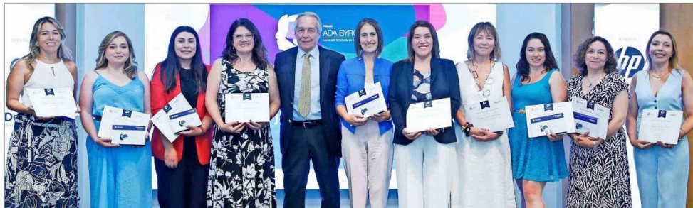
Las diez finalistas del Premio Ada Byron Chile. En esta segunda versión, UNAB recibió más de 180 postulaciones y nominaciones totales.

Tiraje: 126.654 Lectoría: 320.543 Favorabilidad: No Definida