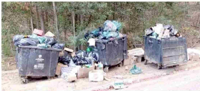
Dicho escenario se presenta desde la semana pasada en algunos sectores de la citada comuna.

El propio edil indicó que en su calidad de autoridad comunal comenzó a recibir registros, tanto fotografías como videos, de