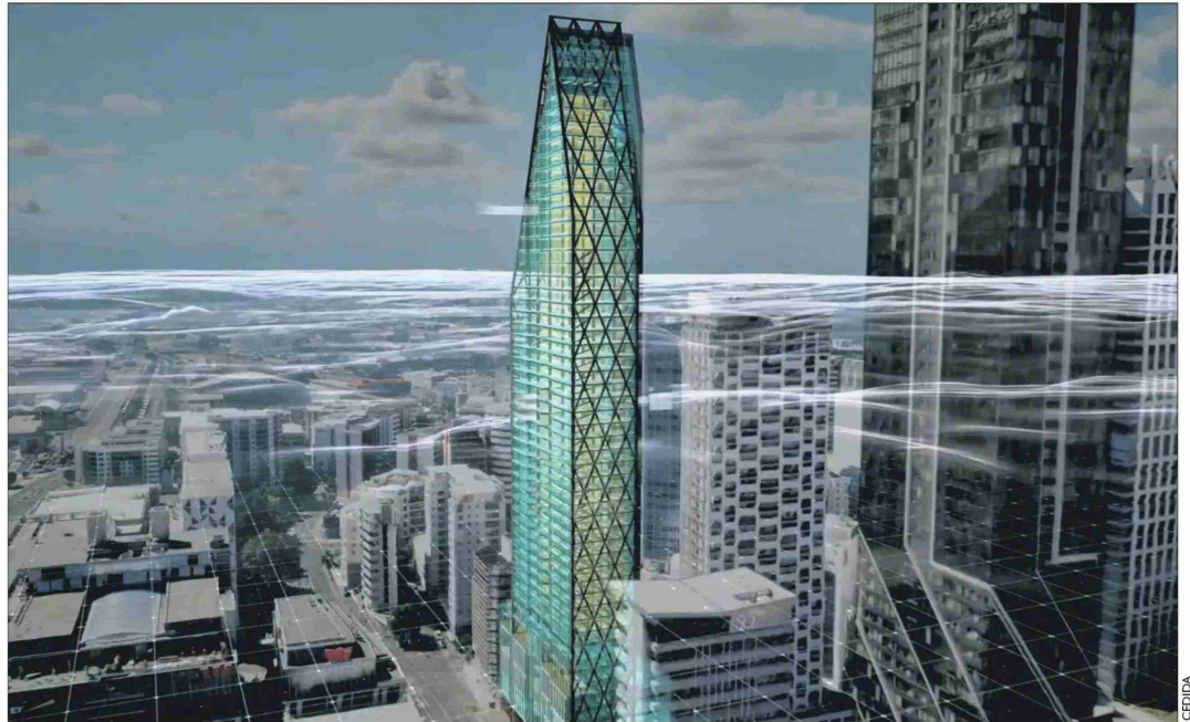
Auckland no es una ciudad sísmica, pero en la zona costera, donde está la torre, los vientos llegan a 80 km/hora.

El engranaje lo define casi como un trabajo de joyería: “Lo que hace este sistema es que, a través del movimiento de un fluido