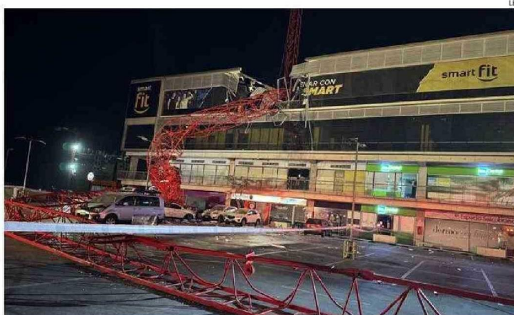
LA GRÚA CORRESPONDE A UNA CONSTRUCTORA AJENA AL RECINTO AFECTADO.

"Hemos evidenciado que la estructura está bien