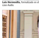
Ángela Vivanco, ministra de la Corte Suprema.