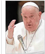
El pontífice está hospitalizado desde el viernes en Roma.

FÓRMULA DE ÚLTIMA HORA | C 4 COLUMNA DE CARLOS PEÑA | A 2