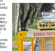
Las medidas de seguridad deben involucrar un esfuerzo mancomunado entre diversas instituciones, plantean especialistas.

Añade que "luego la estrategia debe considerar incentivos económicos para las familias y municipios para la reinserción escolar de jóvenes desahuciados; instalación de 'oficinas de oportunidades laborales' de cooperación público-privada para dar trabajos licitos a jóvenes y adultos".