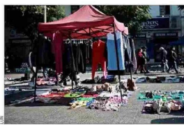
DERRUIDOS.— Sectores de la capital como Meiggs o la Vega Central se han deteriorado de la mano de la actividad informal.

Con distintos tipos de medidas, que van desde equipos de fiscalización hasta el aumento de permisos municipales, algunas autoridades han buscado enfrentar el fenómeno del comercio ambulante, que prolifera en barrios comerciales de las distintas ciudades.