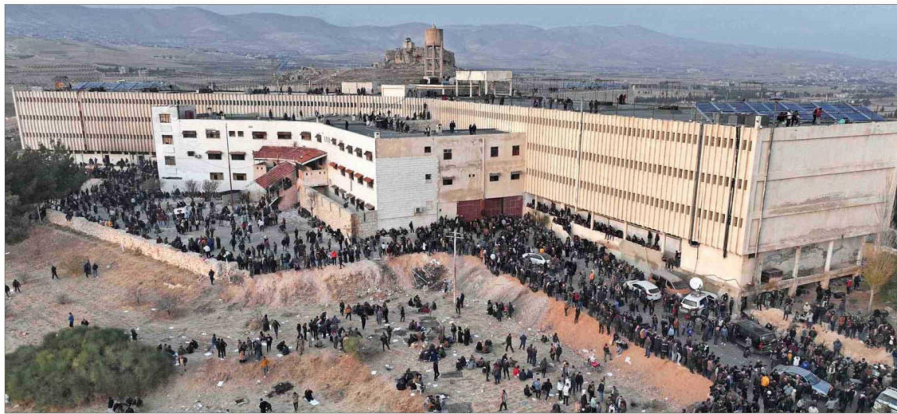
CIENTOS DE PERSONAS llegaron a la cárcel de Sednaya, conocida como “matadero humano” luego que fuera liberada por los rebeldes.