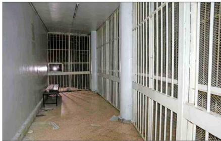
LAS CELDAS quedaron vacías tras la liberación de decenas de presos.