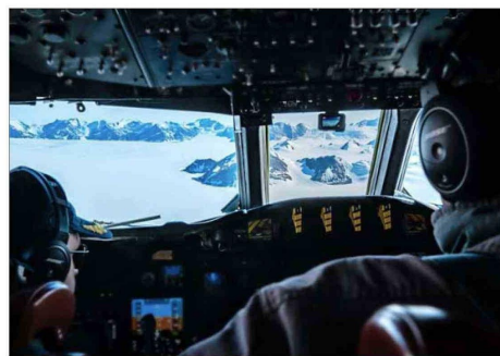
AERONAVE. — El cuadrimotor P-3 "Orión" fue construido por la empresa estadounidense Lockheed Martin y en 1993 fue puesto en el servicio naval.

Tras seis meses de preparación, el vuelo, calificado como "histórico", despegó de Punta Arenas y luego de más de cinco horas de travesía llegó a su destino en la latitud 80° Sur. Es el punto más austral en que Chile actualmente ejerce su presencia. Además, fue el primero de cuatro traslados que permitirán el desplazamiento de más de una