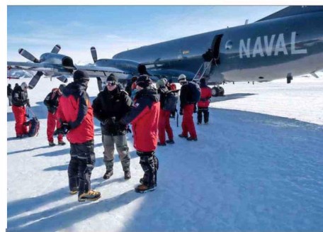
HIELO. — La Armada y el CECs llevan más de 20 años desarrollando investigaciones antárticas. Este año hubo dos vuelos para medir plataformas.

que nos permite operar con estas aeronaves en la Antártica profunda, algo nunca antes realizado. Abre una nueva posibilidad para apoyar operaciones científicas con un mayor radio de acción, además de reforzar la presencia y conexión que mantiene la Armada de Chile con el Continente Blanco".