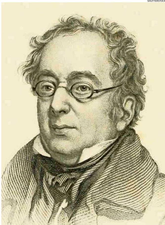
ISAAC DISRAELI PUBLICÓ “CURIOSIDADES DE LA LITERATURA” EN CUATRO TOMOS, ENTRE 1791 Y 1823.