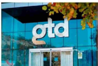
Oficinas centrales de GTD.