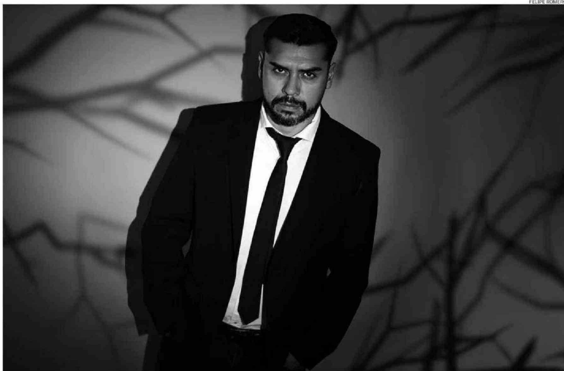
"ME DEMORO MUCHO EN INVESTIGAR, MESES, INCLUSO HASTA UN AÑO ESTOY INVESTIGANDO PARA MIS PROYECTOS", DICE EL AUTOR.

"Todos mis libros se basan en investigaciones. Yo no me demoro mucho en escribir, lo mío es la narrativa breve, me gusta como formato la novelable (narración entre el cuento y la novela), pero, si bien me demoro poco en escribir, me demoro mucho en investigar, meses, incluso hasta un año estoy investigando para mis proyectos", agrega el también autor de "Los que susurran bajo la tierra", cuya área "de investigación en la universidad es la estética del horror" y sus clases