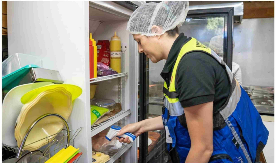
LOS INSPECTORES DE LA SEREMI DE SALUD verificaron el cumplimiento de normativas en materia de seguridad alimentaria, comercialización de juguetes y expendio de fármacos.