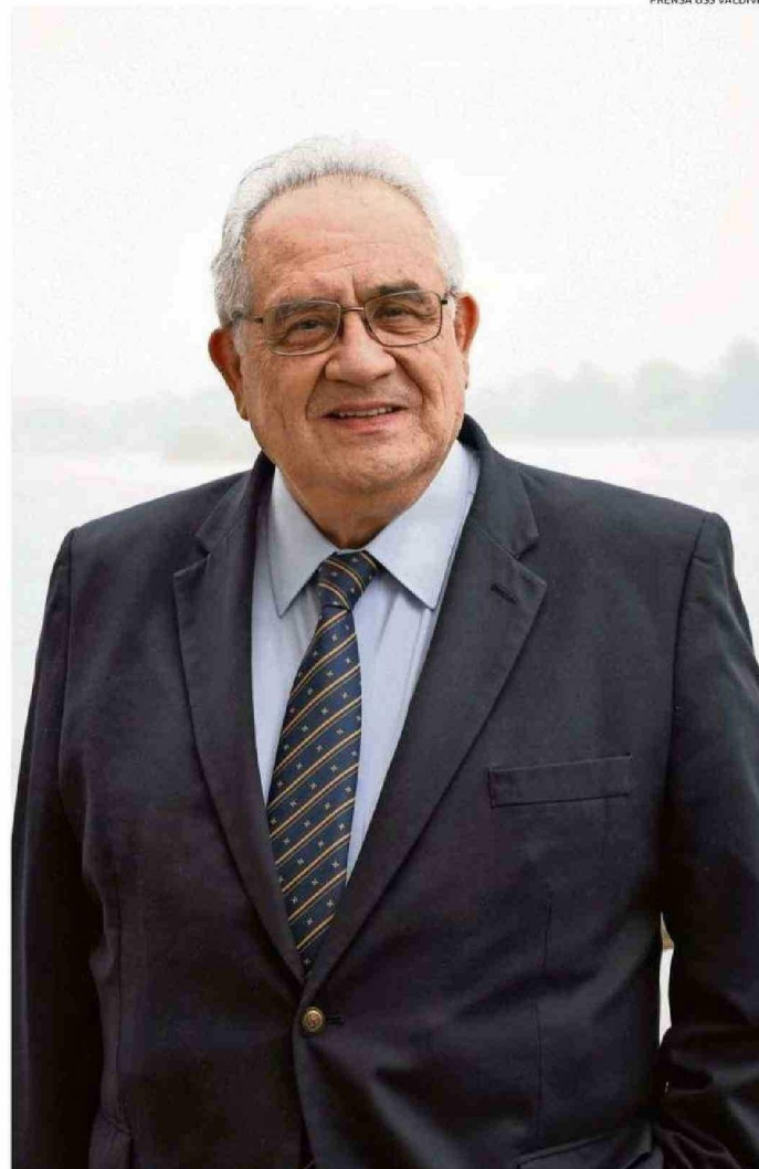
HUGO LAVADOS FUE MINISTRO DE ECONOMÍA Y DESDE 2023 ESTÁ AL MANDO DE LA USS.

Y agregó: "Es muy importante para nosotros tener científicos destacados haciendo clases en pregrado. A los estudiantes les brinda una gran oportunidad de acceder a otros conocimientos y ser parte de un proceso de excelencia. Y a los investigadores les permite estar en contacto con las nuevas generaciones, con gente joven, sus intereses y con los déficit