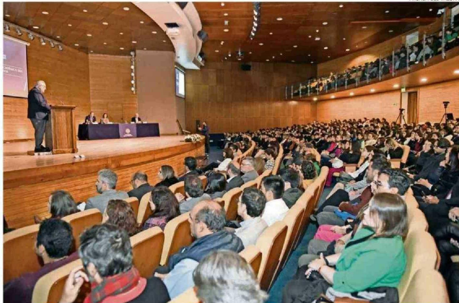
LA CEREMONIA DE CAMBIO DE MANDO SE REALIZÓ EN EL AULA MAGNA DE LA UNIVERSIDAD, EN CALLE GENERAL LAGOS, EN VALDIVIA.