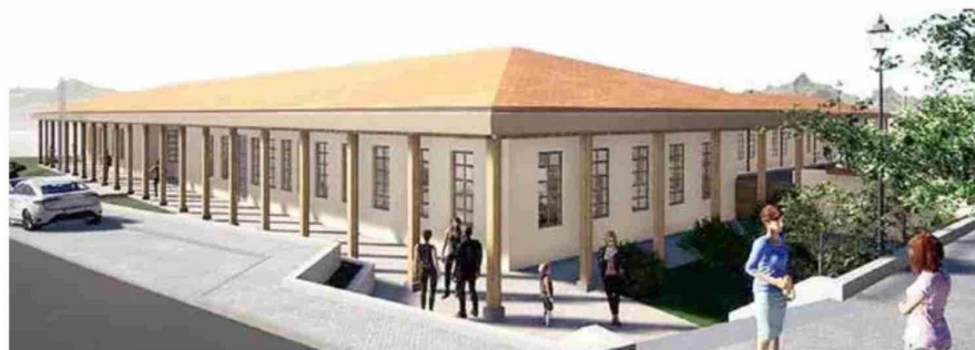
El establecimiento contará con 1.698 metros cuadrados, permitiendo beneficiar a una población de 5.000 personas.