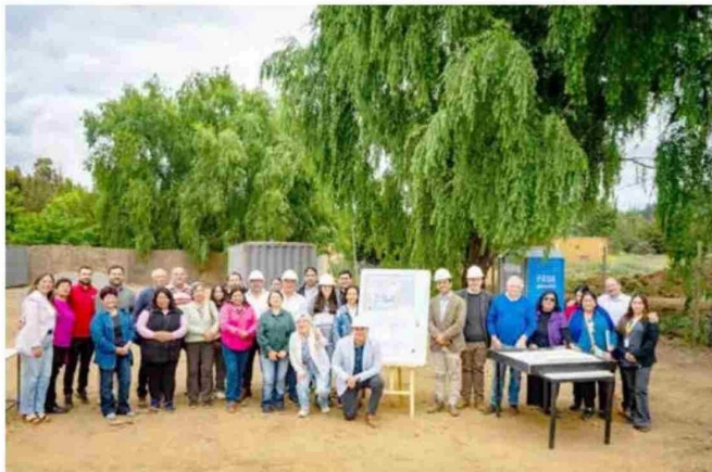
Dicho espacio brindará un acceso más eficiente a los servicios de salud en Vichuquén.