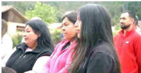
Vecinos también fueron testigos del comienzo de las esperadas faenas.

El nuevo Cesfam de Vichuquén no solo busca mejorar la atención sanitaria, sino también optimizar y garantizar un acceso más eficiente a los servicios de salud para los vecinos de la comuna. La empresa que estará a cargo de su ejecución corresponde a la constructora CASAA Ltda.