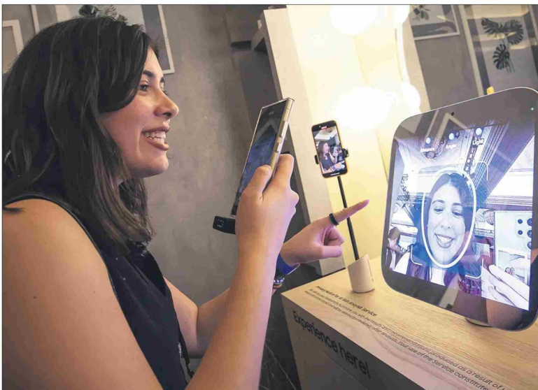
El Micro Led Beauty Mirror de Samsung ya se usa en Corea.

conviertan en preocupaciones más grandes".