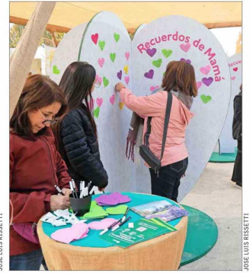
Niños escribieron mensajes de afecto a sus mamás, les dieron flores y otros presentes.