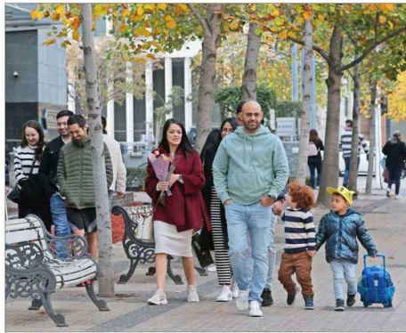
A pesar de las bajas temperaturas , muchas familias se encontraban paseando por la Plaza Perú, en Las Condes, o almorzando en Isidora Goyenechea.