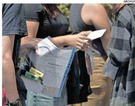
MILES DE ESTUDIANTES RENDIRÁN EL EXAMEN.