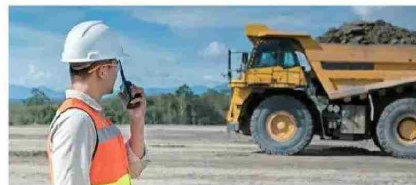
La minería requiere personal altamente capacitado para operar, mantener y supervisar estos equipos.

Se estima que en la industria minera se ha producido un cambio cultural. Uno de los factores más importantes en esta transformación en las mineras de Chile es la creciente participación femenina, que en los últimos 12