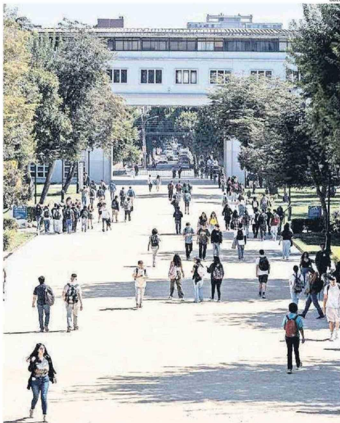
CON EL PASO DE LOS AÑOS, CADA VEZ SE ESTÁ HACIENDO FUNDAMENTAL OPTAR POR EL DOCTORADO.

Según datos entregados por la institución, ca-