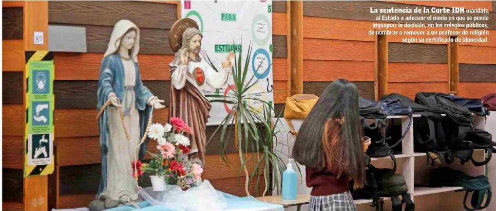
La sentencia de la Corte IDH mandata al Estado a adecuar el modo en que se puede impugnar la decisión, en los colegios públicos, de nombrar o remover a un profesor de religión según su certificado de idoneidad.

LA LIBERTAD RELIGIOSA ESTARÍA EN RIESGO, ADVIERTEN DESDE DISTINTAS CONFESSIONES: