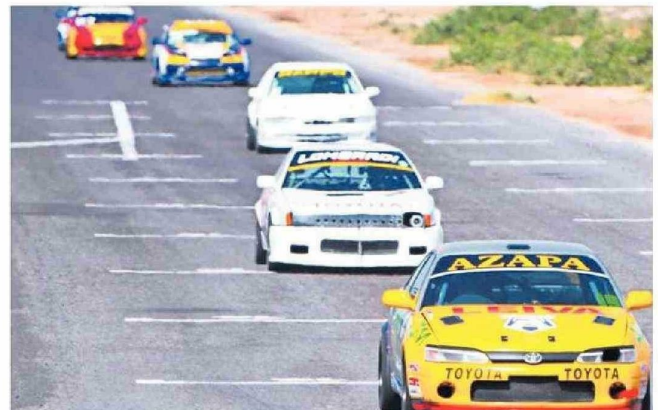
PRÓXIMA FECHA A DISPUTAR SERÁ EL 11 DE AGOSTO CON EL "GP DIPORT - HORNITOS DE CHILLÁN".