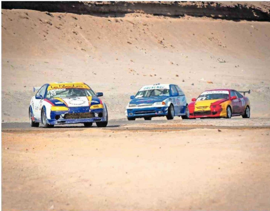
LOS MÁS EXPERIMENTADOS SABEN SORTEAR CAMINOS Y RECORRIDOS ENTRE TERRENO ERIAZO, PISTA, Y CURVAS.

Tiraje: 7.300 Lectoría: 21.900 Favorabilidad: No Definida