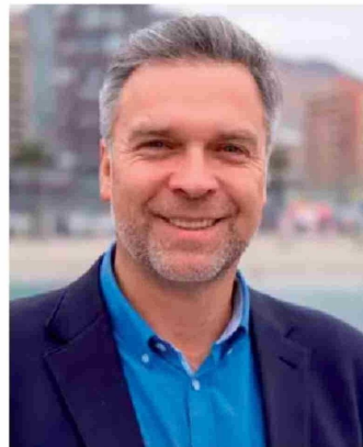
Sacha Razmilic, alcalde electo en Antofagasta.