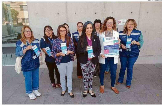
ENCUESTA ES ANÓNIMA. RESPONDERLA NO AFECTA ENTREGA DE BENEFICIOS SOCIALES, ASEGURAN.

de Valparaíso, esta representa un 10,7% de la muestra total, lo que implica que 7.994 domicilios serán visitados en total.