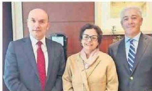
LA MINISTRA DE MINERÍA, AURORA WILLIAMS.