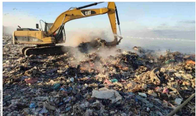
El terreno en conflicto es el del vertedero, que colinda con el futuro relleno.

Continúa el oficio: "Como en este informe se evidencia alteración de deslindes y explotación de material de cantera, obviamente sin la autorización del Gobierno Regional, propietario del inmueble, se recomienda un nuevo reconocimiento, esta vez instrumental geodésico para efectuar un levantamiento y modelación 3D del terreno". El objetivo era precisar "el área ocupada y el volumen de material extraído, sin autorización por las operaciones del vertedero municipal".