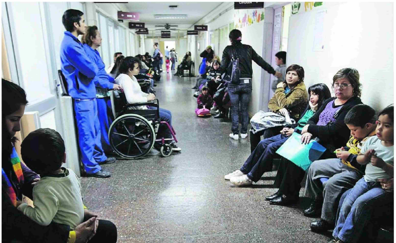
► Los centros de salud clasificados con exposición alta (35) cuentan con vigilancia especial cada seis u ocho horas.

Los centros clasificados con exposición alta (35) cuentan con vigilancia especial cada seis u ocho horas. Los de exposición media (34), en tanto, reciben vigilancia especial al menos dos veces al día, y los centros de bajo riesgo (22) tienen vigilancia especial conforme a la disponibilidad de recursos policiales. ●