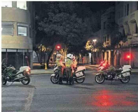
AYER SE LEVANTÓ EL TOQUE DE QUEDA PARA LAS 14 REGIONES.

de los activos de generación que no funcionaron o tuvieron fallas.