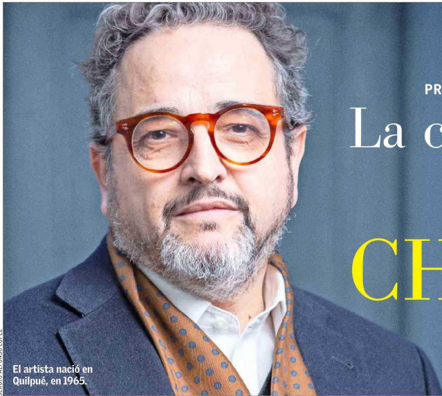
El artista nació en Quilpué, en 1965.

PREMATURO FALLECIMIENTO | Un intelectual multidisciplinario: