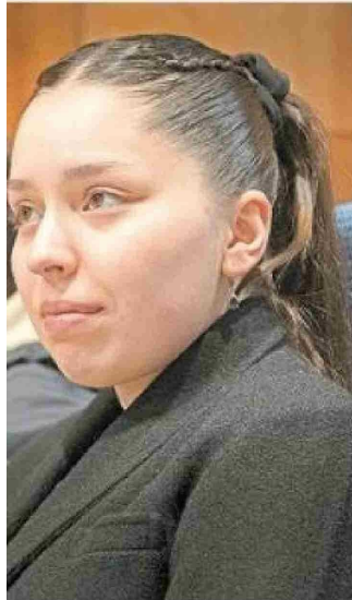
Estudiantes que realizan sus actividades

intolerancia a la lactosa en universitarios; relación entre ansiedad, composición corporal y control autonómico cardiaco en deportistas de combate; efectos del calafate sobre la memoria y el daño neuronal en ratones con Enfermedad de Alzheimer; relación entre vitamina D, depresión, ansiedad y composición corporal de expedicionarios antárticos; relación entre presión arterial sistólica y termorregulación en nadadores de aguas del Estrecho de Magallanes; determinación de prevalencia y asociación clínica en población magallánica de las dos mutaciones asociadas a cáncer de mama más frecuentes en Chile; relación entre especies bacteriales orales, precursores salivales y respuesta cardiovascular al ejercicio en personas mayores, y relación entre calidad de sueño, cantidad de horas de sueño y variabilidad en la luz estacional en adolescentes de Punta Arenas.