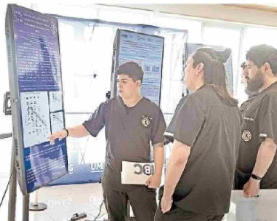
envejecimiento saludable y otras áreas de importancia sanitaria.

El seminario cerró con la expectativa de convertirse en una instancia anual que fomente la investigación en pregrado y fortalezca las áreas estratégicas del Cadi-Umag, centradas en el desarrollo humano y la salud.