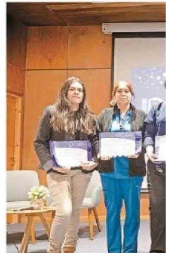
Estudiantes de las carreras de la Salud que financian proyectos vinculados a la investigación.