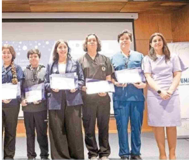
Se ganaron el Fondo Concursable de Apoyo para Estudiantes del Cadi-Umag que acción y/o innovación del área de la salud de la Región de Magallanes.