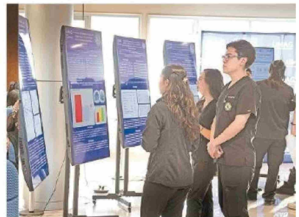
Destacaron los trabajos científicos y estudiantiles en biología molecular y bioinformática, cáncer, Covid prolongado, inmunología, bienestar infante juvenil, etc.