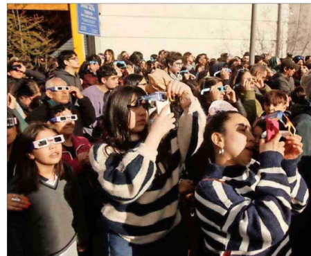
Cerca de tres mil personas repletaron la Plaza de Armas de Coyhaique para ver el eclipse y escuchar al astrónomo y premio nacional José Maza.

“Cuando recién comenzó el eclipse estaba lloviendo un poco, por lo que tuvimos que tapar todos los equipos, pero luego quedó totalmente despejado. Fue