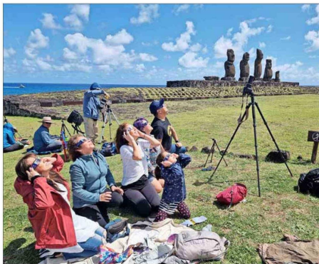
Así se vivió el eclipse en Isla de Pascua. La imagen fue captada por un equipo del CATA que se instaló cerca del Ahu Tahai.

A este eclipse anular se le conoce popularmente como “eclipse anillo de fuego”, ya que la Luna solo cubre la parte central del Sol dejando un aro en su borde, que se observa de un color naranja intenso.