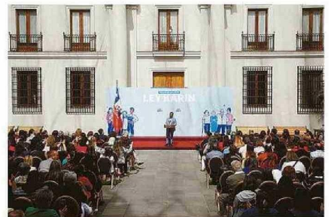
LA NORMA ENTRÓ EN VIGENCIA A PRINCIPIOS DE AGOSTO.