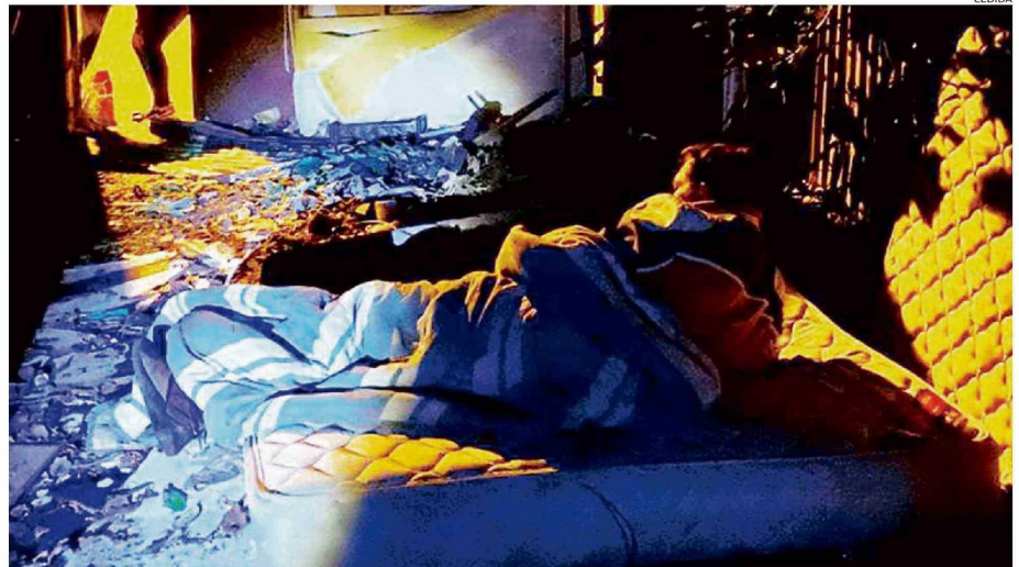
LOS RUCOS IMPROVISADOS EN CUALQUIER RINCÓN DE LAS CALLES SON EL HOGAR DE MUCHAS PERSONAS EN LA REGIÓN.

Agregó que como sociedad existe una enorme responsabi-