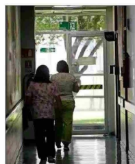
Actualmente, hay 2,5 millones de prestaciones atrasadas.

Otra propuesta, indica Sánchez, es "flexibilizar en forma inteligente la gestión médica para incentivar el trabajo fuera de horarios normales, sujeto a normas e incentivos claros y bien gestionados y supervisados para evitar el abuso", y "resgatar más recursos a establecimientos que claramente lo requieren, pero amarrados a cumplimiento de indicadores y metas, sancionando el incumplimiento".