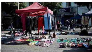
DERRUIDOS.— Sectores de la capital como Meiggs o la Vega Central se han deteriorado de la mano de la actividad informal.

Con distintos tipos de medidas, que van desde equipos de fiscalización hasta el aumento de permisos municipales, algunas autoridades han buscado enfrentar el fenómeno del comercio ambulante, que prolifera en barrios comerciales de las distintas ciudades.