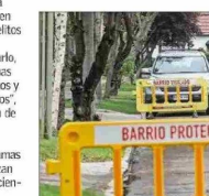
Las medidas de seguridad deben involucrar un esfuerzo mancomunado entre diversas instituciones, plantean especialistas.

Añade que "luego la estrategia debe considerar incentivos económicos para las familias y municipios para la reinserción escolar de jóvenes desahuciados, instalación de 'oficinas de oportunidades laborales' de cooperación público-privada para dar trabajos lícitos a jóvenes y adultos".