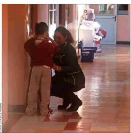
En abril de 2022, el Mineduc lanzó el plan de reactivación educativa, pero los resultados mantienen preocupados a los expertos.

Aunque el Ejecutivo ha destacado mejoras en los indicadores de aprendizajes, asistencia y reactivación escolar, el rezago que dejó la extensa interrupción por la pandemia mantiene la preocupación sobre el desarrollo de los escolares, a la espera de que se evidencien avances sustanciales en la denominada "reactivación".