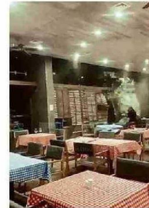
VENTANAL REVENTÓ EN CASINO.

No obstante, la consecuencia más sensible del paso del sistema frontal en la zona fue la muerte de un hombre de 38