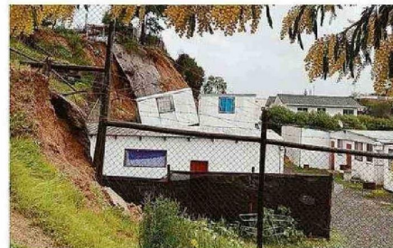
UNA VIVIENDA CAYÓ SOBRE OTRA EN QUILPUÉ. FAMILIA FUE ALBERGADA.