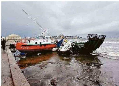
SEIS EMBARCACIONES VARARON EN LA PLAYA DE LONCURA (QUINTERO).

de agua caída se registró la comuna de Algarrobo hasta ayer a las 20.00 hrs. En Viña del Mar y Concón, las precipitaciones sobrepasaron los 84 mm. En Valparaíso, cayeron 40,2 mm.