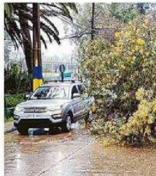
MÚLTIPLES CAÍDAS DE ÁRBOLES.

Agregó que "las agencias y los armadores han tomado las medidas rápidamente y nece-