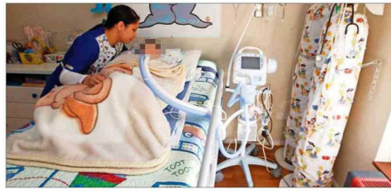
REGISTRO.— En Chile hay, a la fecha, casi diez mil pacientes electrodependientes registrados en la Superintendencia de Electricidad y Combustibles que requieren de diferentes máquinas para vivir.

luz, y la principal crítica que se repite es que hubo demora en la entrega de generadores de emergencia a los pacientes.