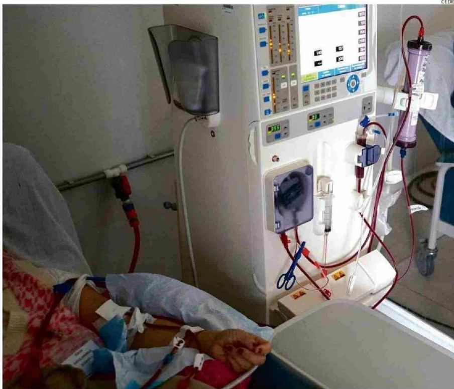
TRES VECES A LA SEMANA ACUDEN LOS PACIENTES DE DIÁLISIS. CADA JORNADA ES DE CUATRO HORAS.

Especifica que están desarrollando un proyecto para